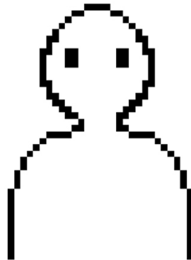
Figure 1. Épées de Damoclès du designer , Clem SOUCHU

Clem SOUCHU, Master 1 « Design, Arts, Médias », Paris 1 Panthéon-Sorbonne, 2021-2022.